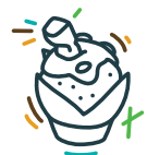
Maxi Muffin 3,50€