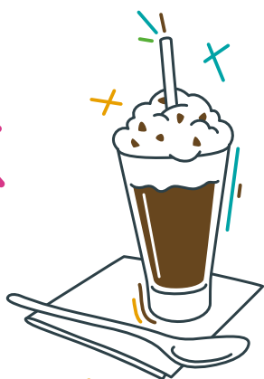
Milk shake signatures