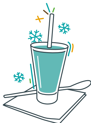
Nos Milkshakes complètement givrés