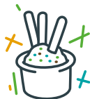
Rilette de sardines Maison & gressin 4,50€